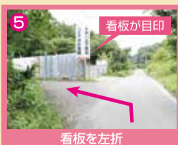
5 看板が目印 看板を左折

カーナビをご利用の方は「多摩八王子霊苑」または住所「八王子市加住町2-399」とご入力ください。