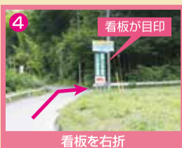
4 看板が目印 看板を右折