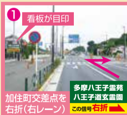
1 看板が目印 加住町交差点を右折(右レーン) 多摩八王子霊苑 八王子道玄霊園 この信号 右折