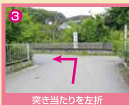
3 突き当たりを左折