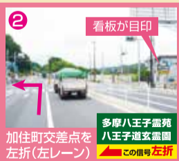
2 看板が目印 加住町交差点を左折(左レーン) 多摩八王子霊苑 八王子道玄霊園 この信号 左折